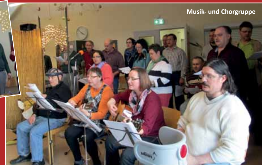
Musik- und Chorgruppe

Alle Jahre wieder - besinnliche Stunden in unseren Bühler Werkstätten