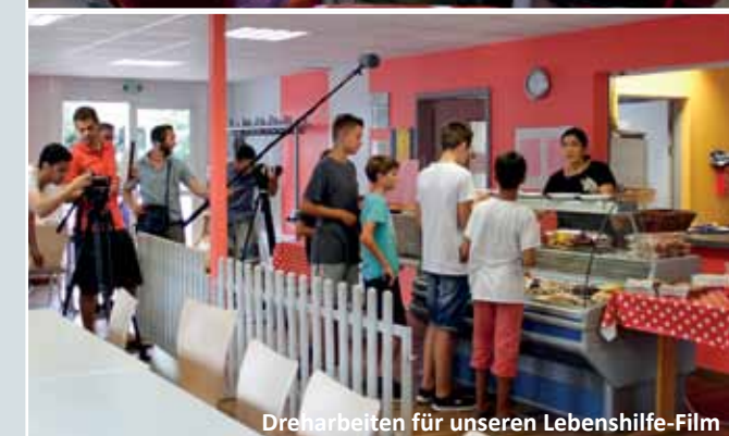
Dreharbeiten für unseren Lebenshilfe-Film