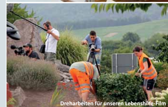
Dreharbeiten für unseren Lebenshilfe-Film