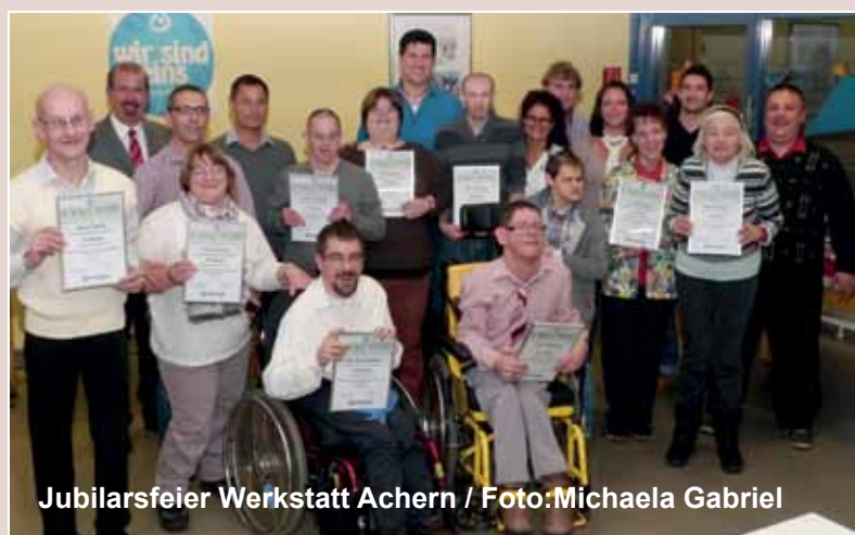
Jubilarsfeier Werkstatt Achern