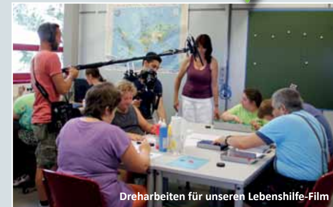
Dreharbeiten für unseren Lebenshilfe-Film