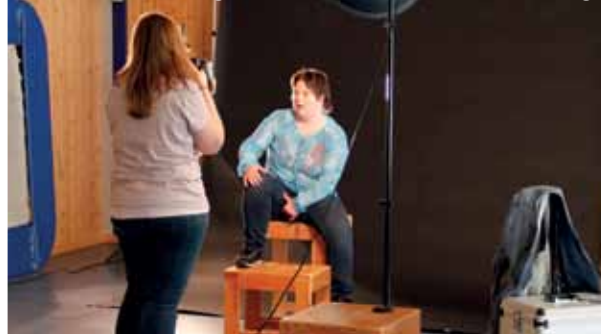
Fotoshootings zu unserer Foto-Wanderausstellung

U nser Lebenshilfe der Region Baden-Baden – Bühl – Achern e.V. feiert im Jahr 2016 ihren 50. Geburtstag. Wie Sie wissen, vertreten wir die Interessen von Menschen mit Behinderungen aller Altersstufen. Wir setzen uns für deren Wohl und Rechte ein. Menschen mit einer Behinderung sollen die Chance erhalten, ihre Fähigkeiten zu entwickeln um ein erfülltes, selbstbestimmtes Leben nach ihren Bedürfnissen und Wünschen mitten in unserer Gesellschaft zu führen.