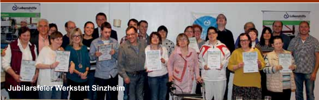
Jubilarsfeier Werkstatt Sinzheim

Im feierlichen Rahmen wurden Ende letzten Jahres unsere langjährigen Mitarbeiter (Werkstätten Sinzheim und Achern, CAP-Märkte und FuBs) im Beisein von ihren Gruppenleitern, Angehörigen und Betreuern für Ihre Treue geehrt. Sie bringen ihre Fähigkeiten und ihren Fleiß seit 10, 20, 25, 30 und 35 Jahren ein.