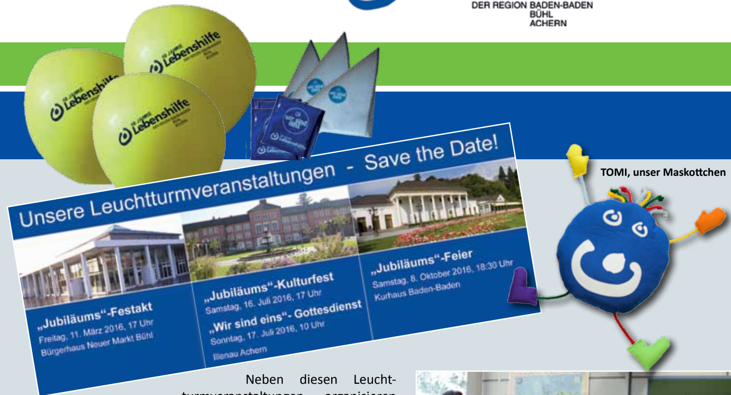
TOMI, unser Maskottchen